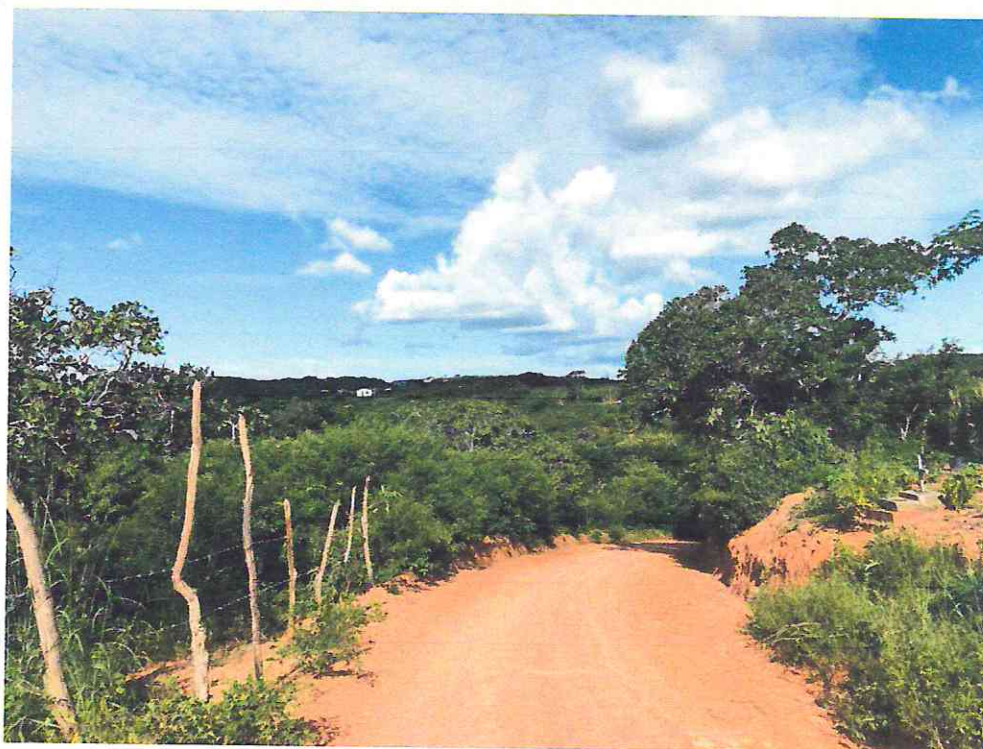
ALTO DE ZÉ DE ANA