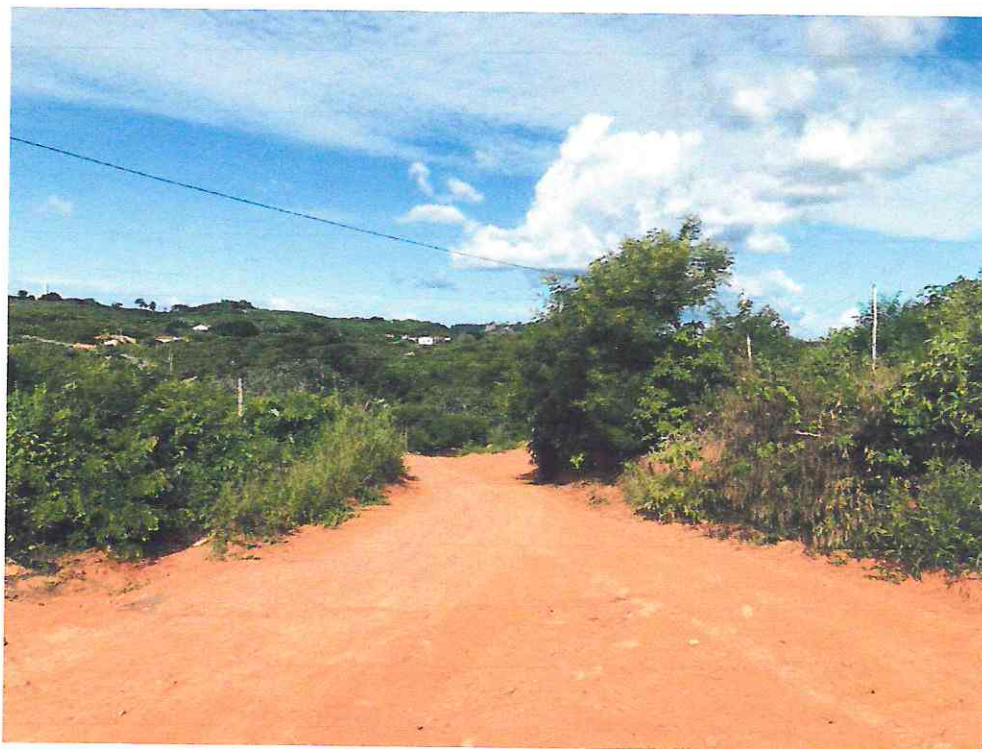
ALTO DE ZÉ DE ANA