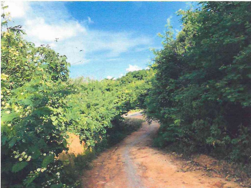
ALTO DE ZÉ DE ANA