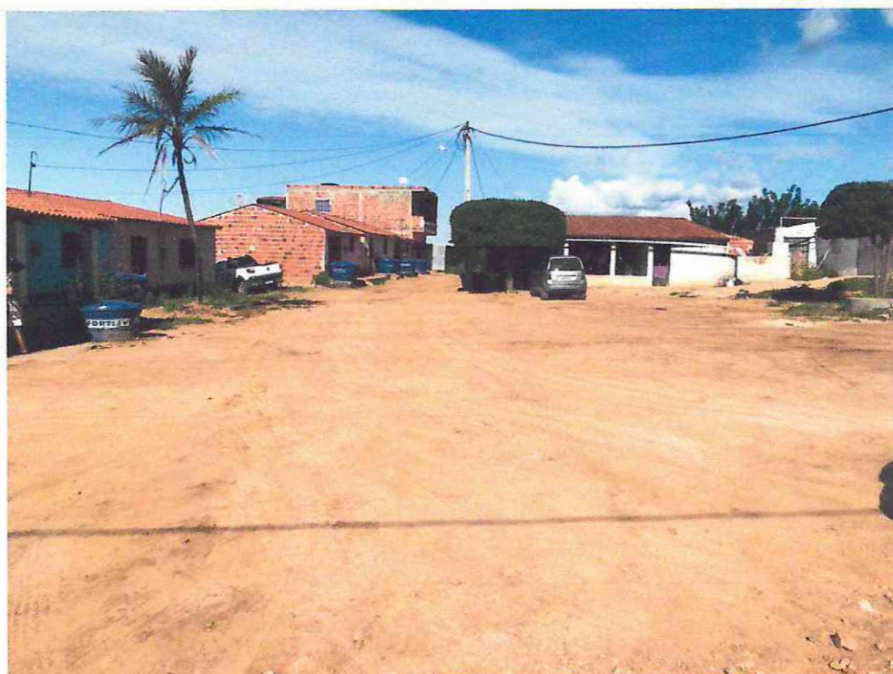
VILA MANOEL DA PALHA