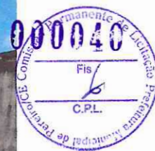
VILA MANOEL DA PALHA