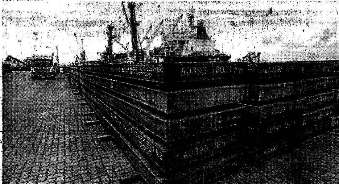
TARIFA de 25% imposta pelos EUA sobre o aço e alumínio entrou em vigor no dia 12

Estado do Ceará - Prefeitura Municipal de Tauá - Aviso de Licitação. A Prefeitura Municipal de Tauá, por meio do Ordenador de Despesas da Secretaria de Esportes (órgão gerenciador), torna público aos interessados a abertura do Pregão Eletrônico nº 11.03.001/2025-GM, cujo objeto é o Registro de preços para futura e eventual aquisição de material esportivo, para atender as necessidades das Unidades Gestoras do Município de Tauá - CE. Com Abertura das Propostas para o dia 27 de março de 2025, às 08h00min. O edital completo está disponibilizado em: https://www.gov.br/pncp/pt-br , https://novobmmet.com.br/ , https://municipios-licitacoes.tce.ce.gov.br/ e https://www.taua.ce.gov.br/licitacao.php . Tauá-CE, 12 de março de 2025. Ordenador de Despesas.