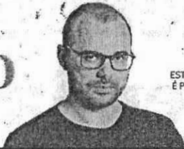
ESTA COLUNA É PUBLICADA TERÇA